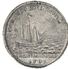
3279. 1704. 5 Dukat, Guinea